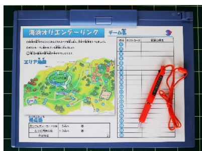
解答用紙、バインダー、ペン

事務室に、団体ごとにケースに入れてまとめて置いてあります。 受け渡しの際に、活動について所員が簡単な説明をしますので活動時間に合わせて受け取りにくるようお願いします。 終了後は、道具の数を確認して、ケースごと返却してください。 返却の際は必ず所員に一声かけてください。