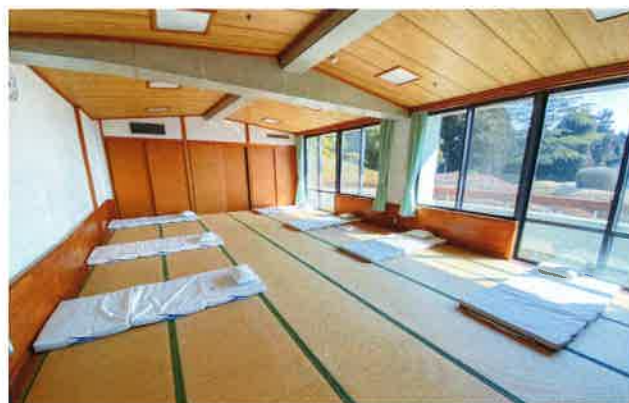
大部屋での布団の敷き方(7名)