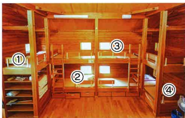
ロッジの2段ベット(定員8名、1段目・2段目 各4名)