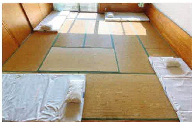
本館での布団の敷き方(4名)